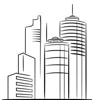
CORPORATIVO E PME

Seja preventivamente ou corretivamente, nosso modelo de consultoria 360° garante a eficiência e a segurança que você busca em termos de compliance imobiliário, auditoria, mapeamento de não conformidades e mitigação de riscos.