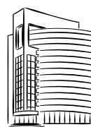
INVERSORES Y FONDOS INMOBILIARIOS