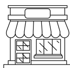
COMERCIO, REDES Y FRANQUICIAS